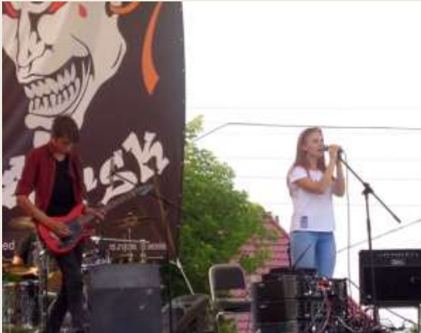
«Новосибирской области-80 лет» фестиваль "Кислород" 2017г.

Всего участниками наших мероприятий стали не менее 4000 человек. Зачастую на фестивалях трудно решался вопрос с ударной установкой (у многих местных непрофессиональных групп не хватает ударной установки) и освещением (для проведения мероприятий и красивого показа не хватает света), а также не хватало творческой площадки для проведения зимних мероприятий. Музыка явилась объединяющим началом для людей всех социальных слоёв и всех возрастов. После начала пандемии 2020 года мы перестали заниматься проведением фестивалей, а сделали упор на создание собственной концертной площадки. В здании байкпоста «Упорный» была смонтирована и установлена сцена, сделана звукоизоляция для хорошей акустики, куплено оборудование. Уже на базе этого пространства мы смогли провести 2 концерта. В планах на 2023 год, строительство и монтаж уличной сцены, что позволит увеличивать масштаб, организуемых нами концертов и мероприятий.