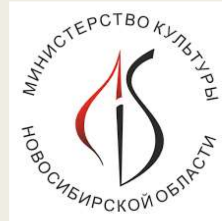
Министерство культуры Новосибирской области

МОО ТР НСО «Ресурсный центр общественных инициатив»