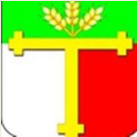
Администрация Татарского района