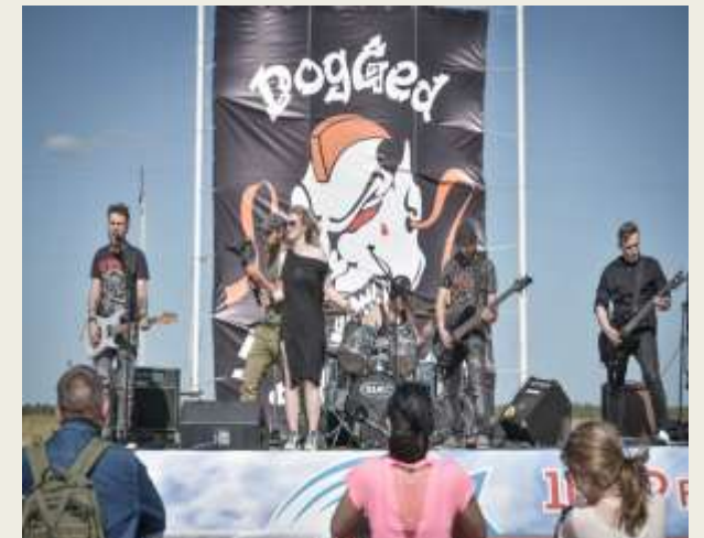
Третий Межрегиональный музыкальный фестиваль «КИСЛОРОД» 2019г.