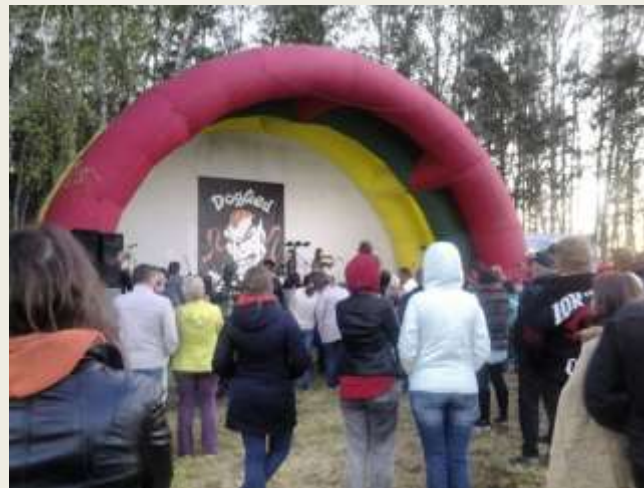
Музыкальный рок фестиваль "Кислород" 2018 г.