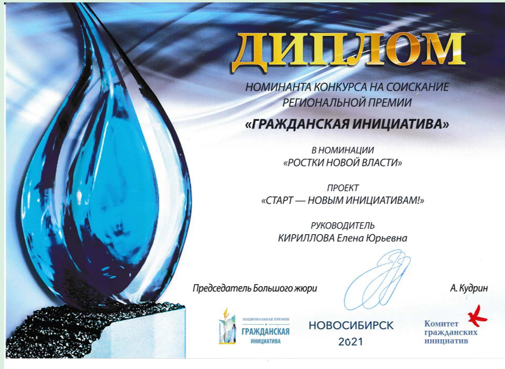
Национальная премия "Гражданская инициатива"