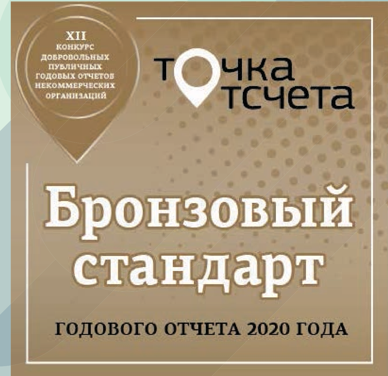
Конкурс публичных годовых отчетов НКО «Точка отсчета» в 2021 году